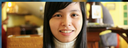
Be / Age 21

Necklace Earrings Bracelet Hair Accessory Other